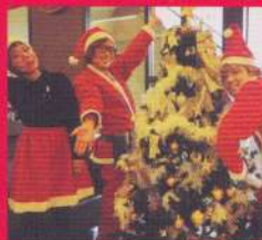
クリスマスパーティー